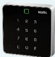
B-web 9001 B-web 9110 Erfassungseinheit für Zutrittskontrolle mit oder ohne PIN-Tastatur