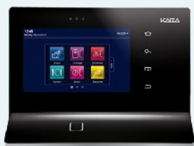
B-web 9700 Informations-Terminal mit verschiedenen Apps für unterschiedliche Aufgaben