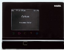
B-web 93xx Terminal zur Zeit- erfassung LEGIC, MIFARE, Biometrie