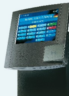
B-Net 9580 Multifunktionsterminal für Mitarbeiterkomm- unikation, Workflow- management und Kantinendatenerfassung