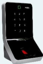
B-web 9105 FP Erfassungseinheit mit biometrischem Fingerprint Sensor zur Personen- identifikation