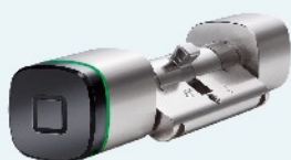
Kaba Digitalzylinder mit integriertem LEGIC oder MIFARE-Leser