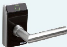
Kaba c-lever compact kompakter mechatronischer Beschlagsleser, zylinderunabhängig