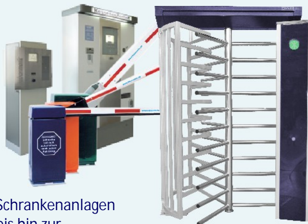
Schrankenanlagen bis hin zur Parkhaustechnik