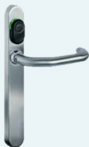
Kaba c-lever mechatronischer Beschlagsleser, zylinderunabhängig