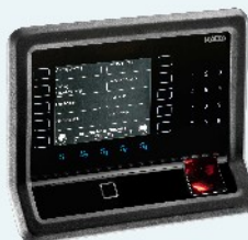
B-web 9500 individuell konfigurier- bares Betriebsdaten- erfassungsterminal