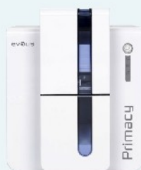
Ausweiserstellungssysteme für eine individuelle Ausweispersonalisierung